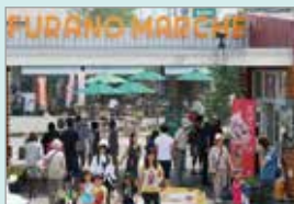
中心市街地のにぎわい滞留拠点