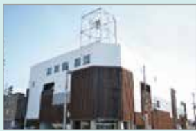
空きビル再生事業