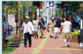
空き地・未利用地の解消